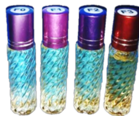
Gambar 1. Roll On Minyak Atsiri Kulit Jeruk Kasturi