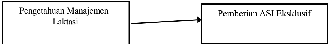
Diagram 3.2 Kerangka konsep