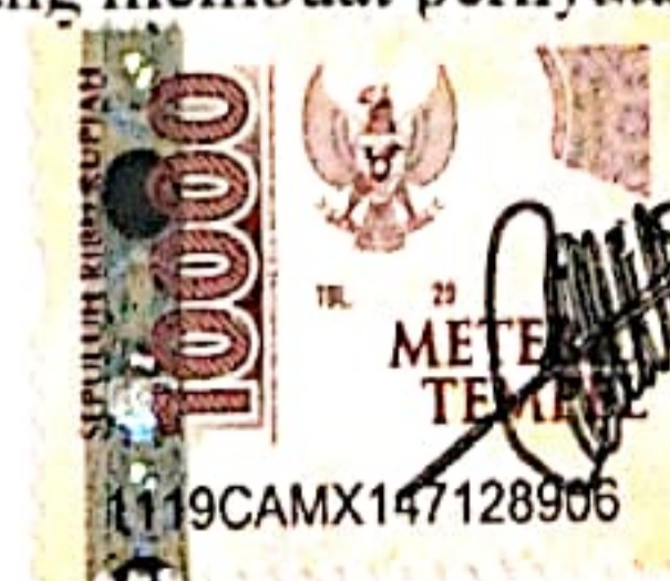
Agnes Yesica Sari

Padang, 21 Januari 2025 Yang membuat pernyataan.