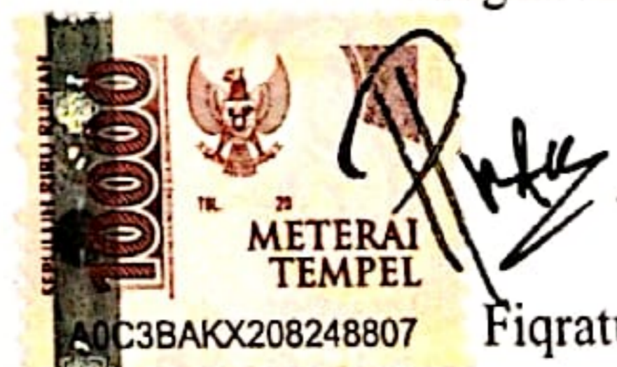
Fiqratul Aulia Puti

Padang, 19 Desember 2024 Yang membuat pernyataan,