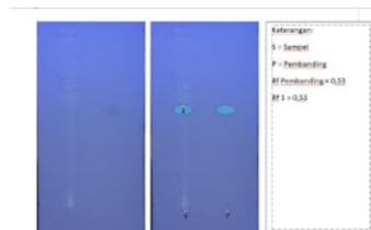
Gambar 2. Hasil KLT pada sinar ultraviolet 365 nm.

Uji kuantitatif kuarsetin dengan teknik HPLC memperlihatkan plot grafik AUC dengan puncak kuarsetin. Hasil kuantitatif terlihat pada konsentrasi sampel 5000 ppm dengan kadar rata-rata sejumlah 0,003% seperti terlihat pada gambar 3.