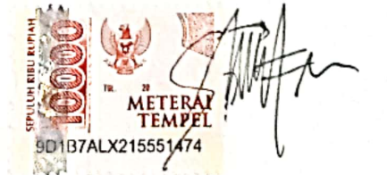
Silfi Arty Medika