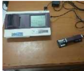
Gambar 1. Surface roughness tester (Mitutoyo SJ 301)

Hasil pengukuran akan muncul pada monitor surface roughness tester (Mitutoyo SJ 301) dalam bentuk angka-angka digital, seperti pada Gambar 1.